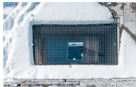
Sicht von oben: Der Klappdeckel ist so klein, dass kein Kind durchschlüpfen kann.